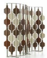
Room divider pag.22